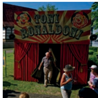
DE STIJLE, WANT... 15u + 17u