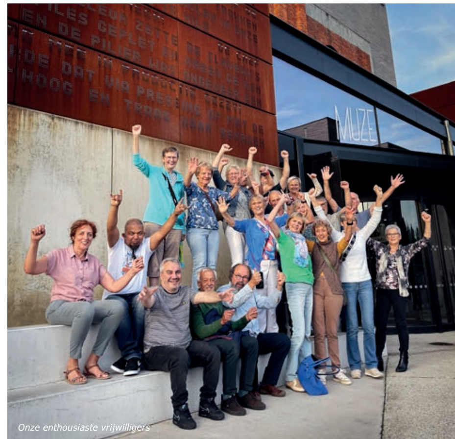
Onze enthousiaste vrijwilligers