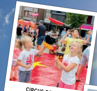
CIRCUS DE SVEN 11u30-15u30