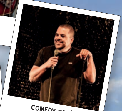
COMEDY CAFÉ 13u30-15u