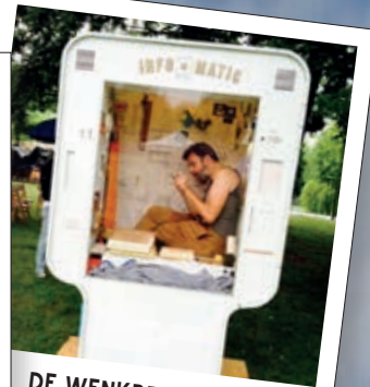
DE WENKBRAUWERIJ 13u30 + 16u30