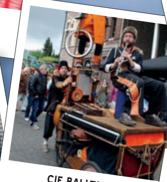
CIE BALLTAZAR 15u45 + 18u30