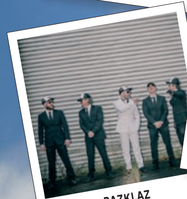
BAZKLAZ 13u + 15u + 18u